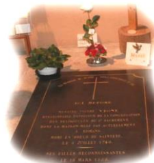
Túmulo do Bem-aventurado Pierre Vigne Igreja de Privas

Uma testemunha de sua morte em Rencurel, em 8 de julho de 1740, escreveu “ sua humildade atraía a estima de todos os povos... ele tinha uma força e uma coragem extraordinárias... não devemos deixar de falar da caridade, que era a mais brilhante de suas virtudes. ” Era a Eucaristia, Sacramento de Amor, que alimentava cada dia sua “caridade”, resposta ativa de seu coração que tinha “ valor e brilho aos olhos de Deus ”.