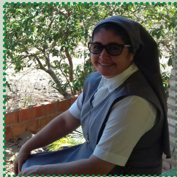
Ir. Ronalda R.S.S.S

Então, esta Seara pode ser a Congregação das Religiosas do SS. Sacramento. A vocacionada não deve perder tempo por conta do medo e dos empecilhos. Ao contrário, procure a orientação de uma Irmã Sacramentina e, faça seu CAMINHO VOCACIONAL, sentindo-se livre para conhecer as diversas formas como estas Consagradas servem a Igreja, em qualquer lugar que estejam inseridas no mundo sedento desse amor incondicional.